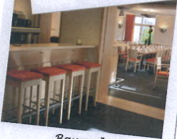
Bar und Kachelofenzimmer