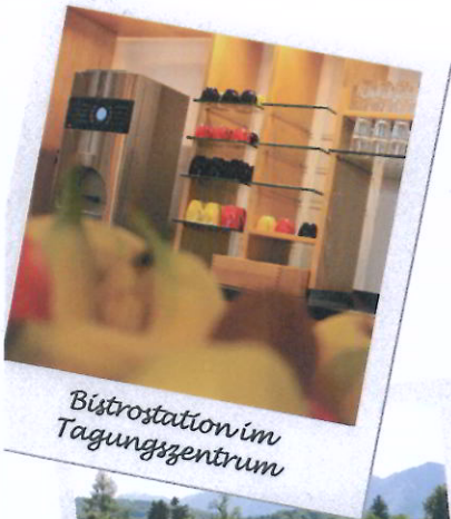
Bistrostation im Tagungszentrum

Das Hotel Alpenblick ist zum wiederholten Male ausgezeichnet worden.